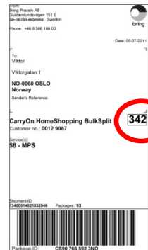
Transportlabel - pakker

(CarryOn Business BulkSplit og CarryOn HomeShopping BulkSplit)