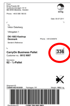
Transportlabel - paller