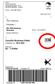
Transportlabel - paller

Indgår i BulkSplit-forsendelsen, der skal udleveres samlet til en modtager, skal pallen mærkes med en CarryOn Business Pallet* transportlabel (kode 336). Der skal ingen Routing Label på pallen.