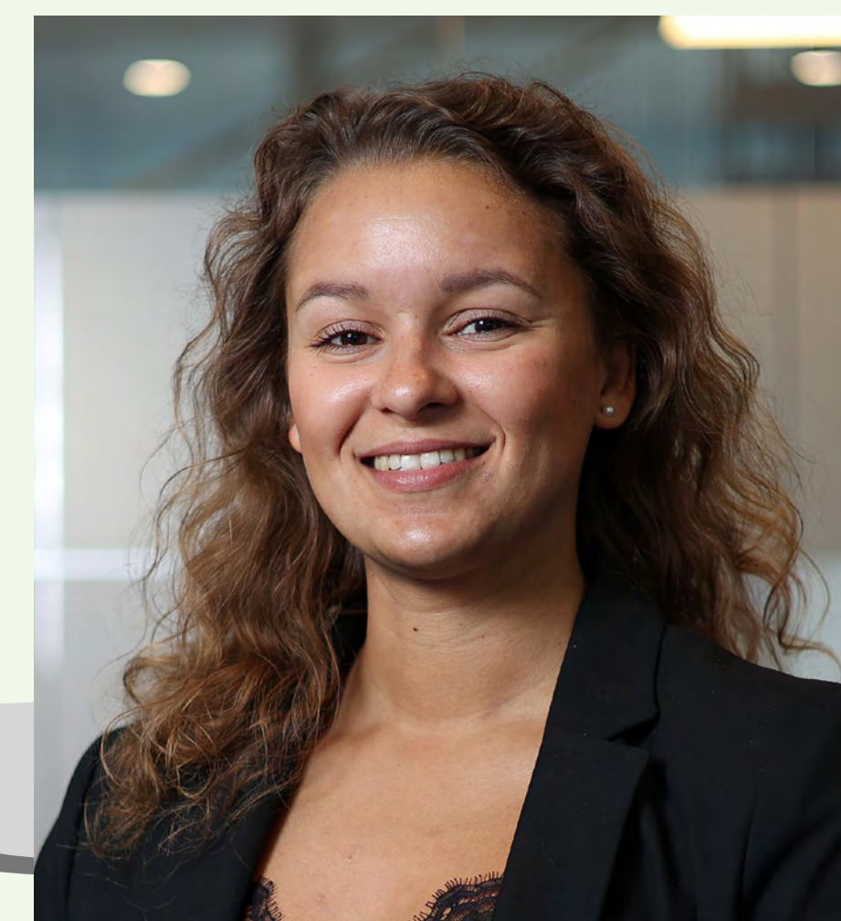
Uddannelse: Civiløkonom med master i Supply Chain Management fra Copenhagen Business School.