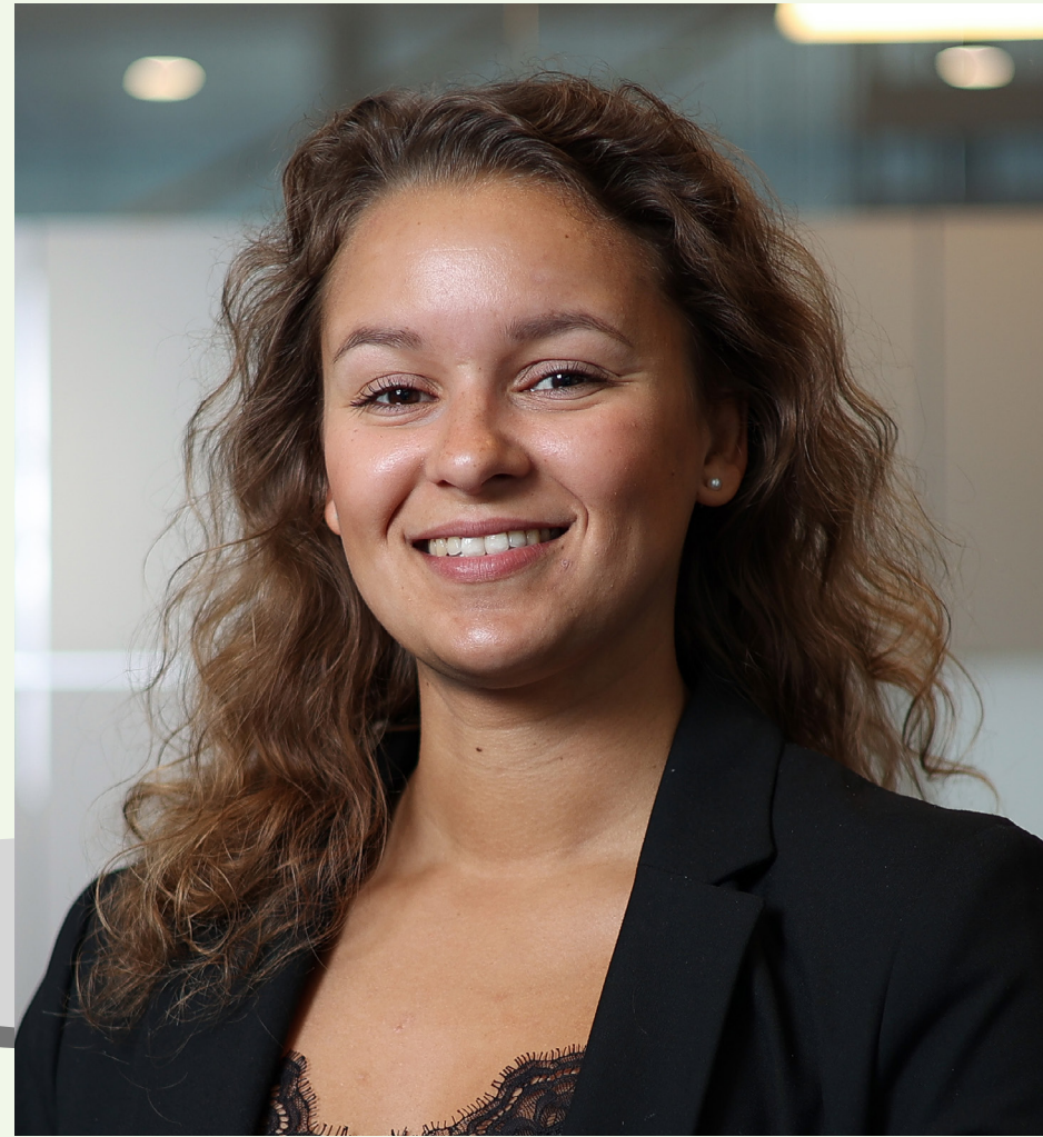
Uddannelse: Civiløkonom med master i Supply Chain Management fra Copenhagen Business School.